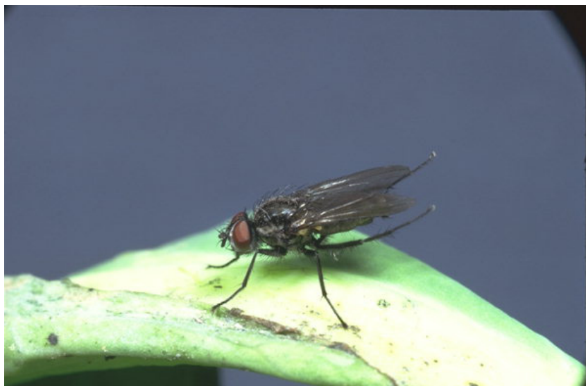
Зелкова мува ( Delia radicum )