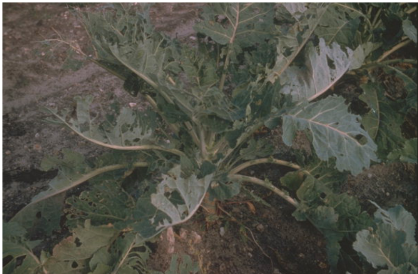
Голем зелкар - штети ( Pieris brassicae )